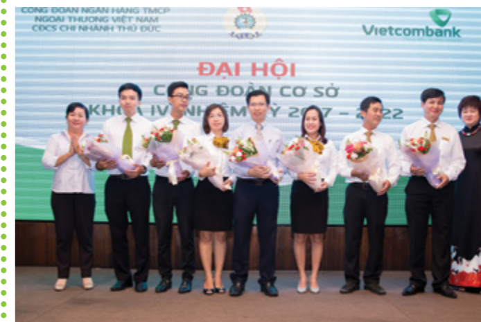
BCH CĐCS Vietcombank Thủ Đức nhiệm kỳ 2017 - 2022 ra mắt ĐH

ĐH đã bầu ra BCH CĐCS nhiệm kỳ 2017 - 2022 gồm 7 đ/c, 1 đại biểu chính thức dự ĐH Công đoàn Vietcombank.