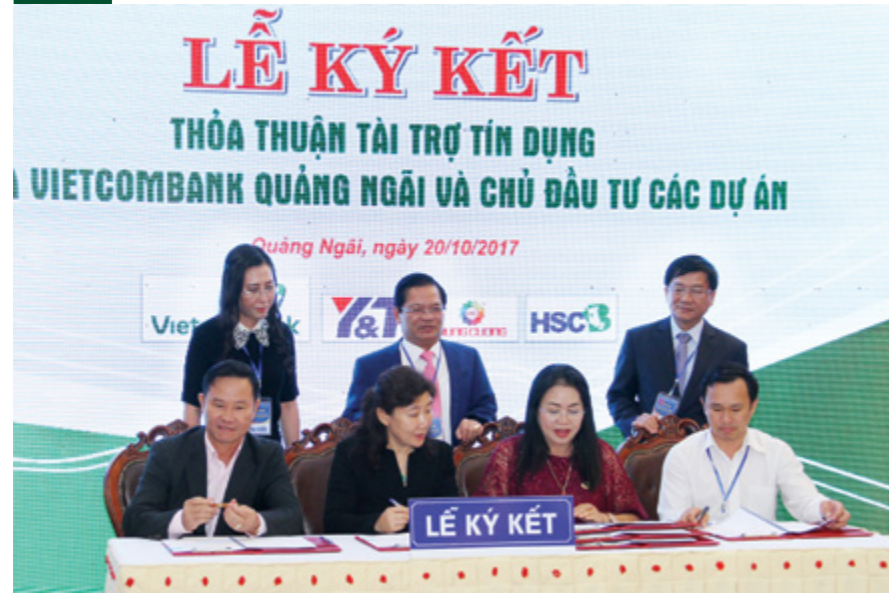
Vietcombank Quảng Ngãi ký kết thỏa thuận tài trợ tín dụng với các nhà đầu tư