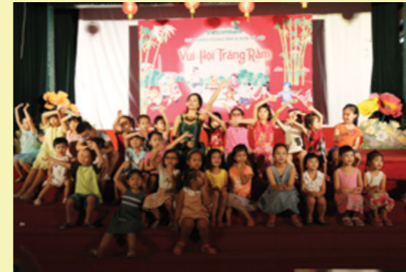
Cảm xúc đạt dào với “nhật ký của mẹ” là món quà các em tặng đến ba mẹ

S áng ngày 01/10/2017, CBCS Vietcombank Hoàng Mai kết hợp cùng Vietcombank Nam Hà Nội tổ chức chương trình Vui Tết Trung Thu - Vui hội Trăng Rằm cho hơn 100 em thiếu nhi là con của CBNV công tác tại các CN với chương trình biểu diễn của Đoàn xiếc TƯ tại Rạp hát Thanh Niên.