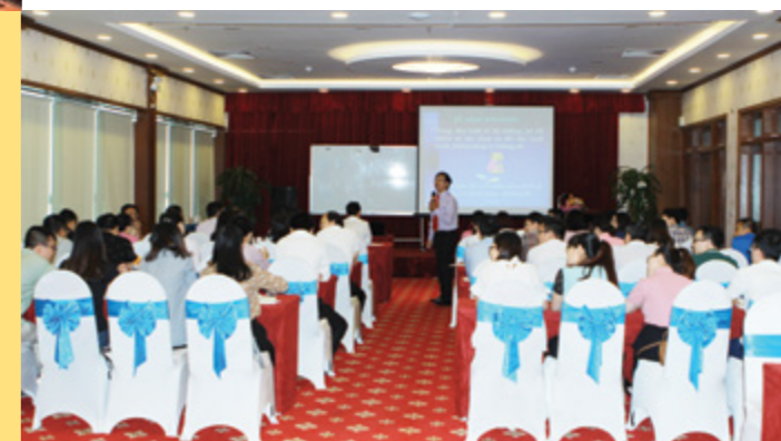
Quang cảnh buổi đào tạo kỹ năng bán hàng giao tiếp và chăm sóc KH

VỪA QUA, VIETCOMBANK NGHỆ AN TỔ CHỨC THÀNH CÔNG KHÓA ĐÀO TẠO KỸ NĂNG BÁN HÀNG, GIAO TIẾP VÀ CHĂM SÓC KHÁCH HÀNG (KH) CHO CÁN BỘ LÀM CÔNG TÁC KH CỦA CN.