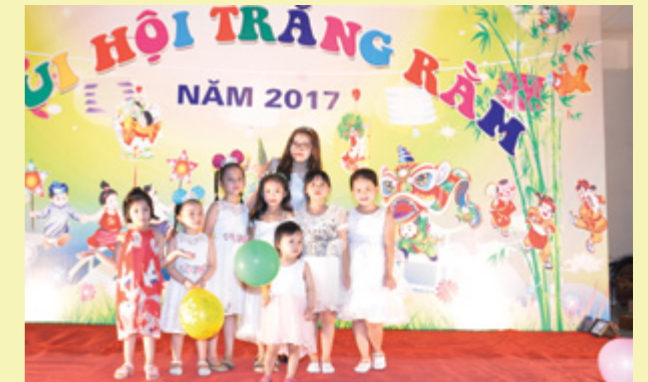
Các cháu thiếu nhi vui phá cỗ cùng Chị Hằng.

Tối ngày 01/10/2017, Đoàn cơ sở Vietcombank Thái Nguyên kết hợp với Đoàn Thanh niên Viễn thông Thái Nguyên tổ chức chương trình “Đêm hội Trăng Rằm năm 2017” cho hơn 100 cháu thiếu nhi là con của CBNV hai đơn vị.