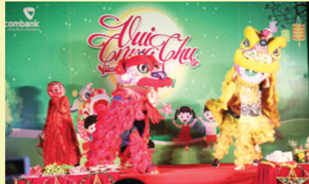
Tiết mục múa lân trong đêm hội