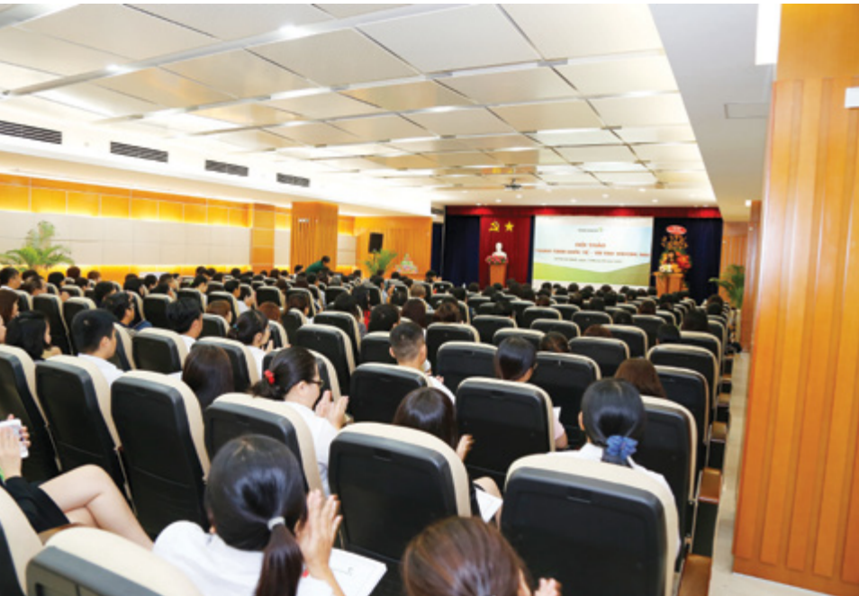
Toàn cảnh Hội thảo