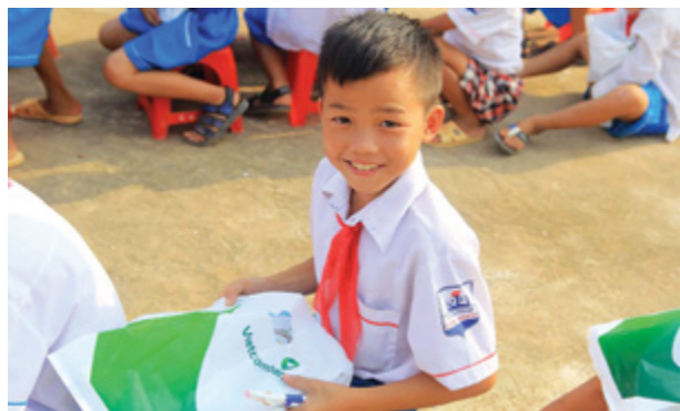
Niềm vui của các em học sinh khi đón nhận các phần quà hỗ trợ của Vietcombank