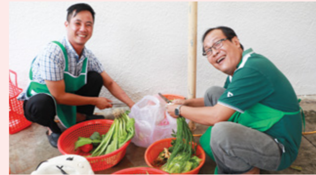
Đàn ông vào bếp

Ngày 15/10/2017, CĐCS Vietcombank Tây Ninh đã tổ chức Cuộc thi nấu ăn cho toàn thể đoàn viên công đoàn. Cuộc thi có 8 tổ công đoàn (TCD) tham gia, mỗi TCD là 1 đội, gồm 2 nam và 1 nữ, nấu bữa cơm cho 10 người ăn, chi phí nguyên liệu 600.000VND với yêu cầu bữa cơm ngon và đầy đủ dinh dưỡng.