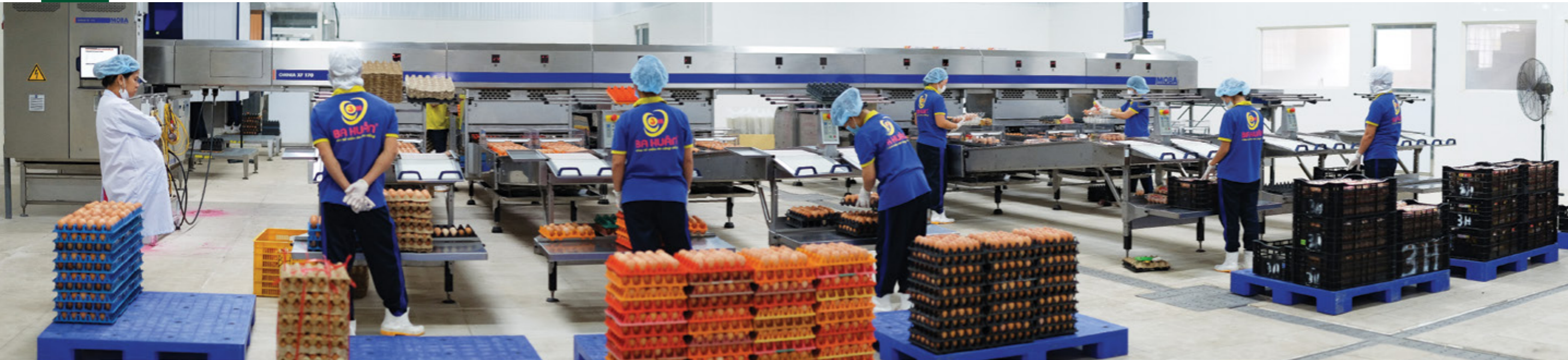
Dây chuyền xử lý và chế biến trứng gia cầm công nghệ cao tại nhà máy của Công ty TNHH Ba Huân Hà Nội – dự án do Vietcombank cấp tín dụng hơn 60 tỷ đồng