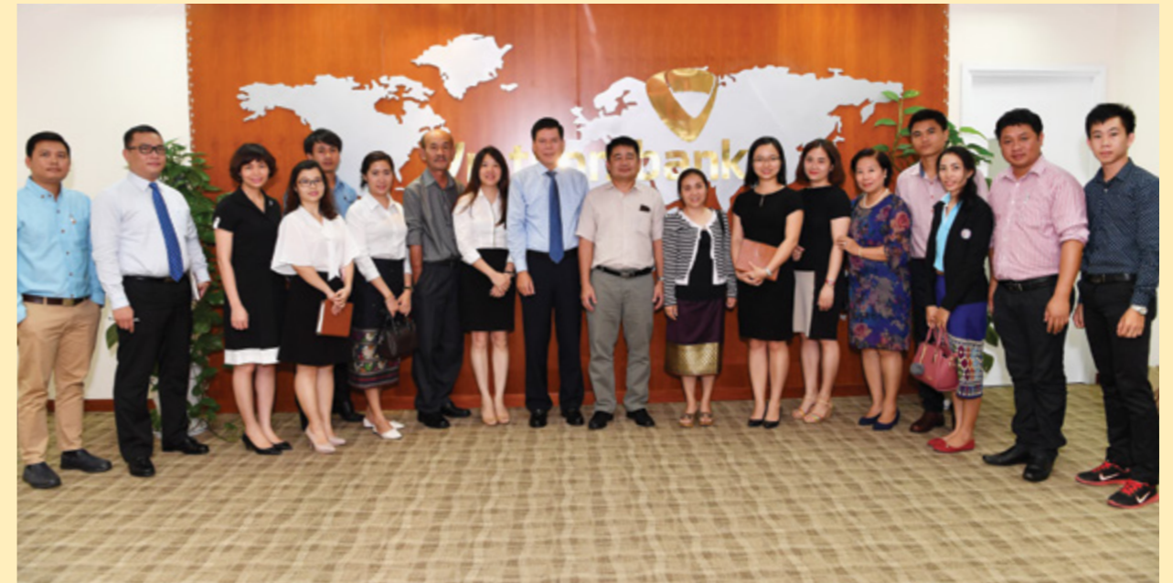
Đoàn báo chí Lào và đại diện Vietcombank chụp ảnh lưu niệm

Cũng trong đợt công tác này, Đoàn Vietcombank đã có các buổi làm việc với một số doanh nghiệp Việt Nam đang hoạt động tại Lào như Viettel Global, Petrolimex; làm việc với đơn vị cho thuê cơ sở làm Trụ sở Ngân hàng Vietcombank tại Lào để thống nhất phương án sửa chữa, cải tạo tòa nhà và ký kết Hợp đồng thuê làm Trụ sở Ngân hàng Vietcombank tại Lào trong chiều ngày 2/11/2017 và ngày 3/11/2017.