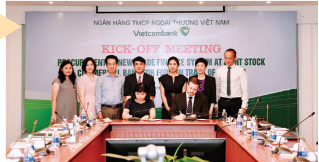
Đại diện Vietcombank và công ty Finastra tham dự tại buổi lễ

SMF (Singapore Manufacturing Federation) là liên đoàn bao gồm các doanh nghiệp chế tạo và các doanh nghiệp liên quan tới hoạt động chế tạo, được thành lập vào năm 1932. Đến nay, với hơn 3.000 thành viên, SMF đã trở thành một trong hai Liên đoàn doanh nghiệp hoạt động mạnh mẽ, tích cực và có tầm ảnh hưởng lớn nhất tới các doanh nghiệp tại Singapore.