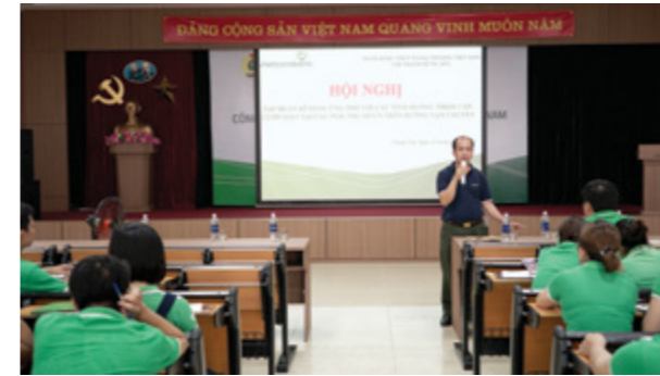
Chuyên gia chia sẻ tại Hội nghị