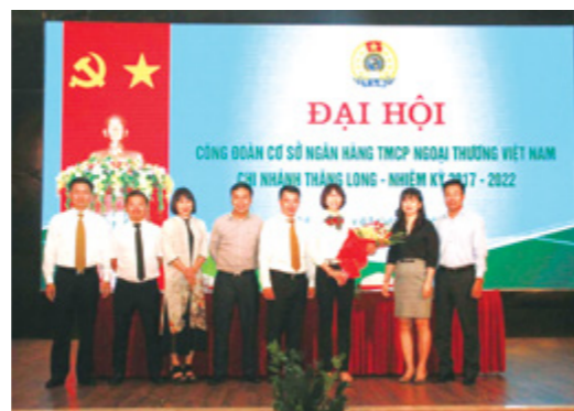
Đại hội CĐCS Vietcombank Thăng Long

Với nhiệm vụ 3 tháng cuối năm còn nhiều khó khăn thách thức, tập thể CBNV CN đã thảo luận và đưa ra nhiều giải pháp tập trung vào các mảng nghiệp vụ để phát triển hoạt động kinh doanh. Tại hội nghị, tập thể CBNV đã cùng Ban Lãnh đạo quyết tâm hoàn thành xuất sắc nhiệm vụ 3 tháng cuối năm, góp phần vào kết quả chung năm 2017 của hệ thống Vietcombank.