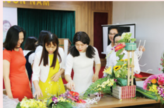
Cán bộ tại chi nhánh chụp ảnh với các tác phẩm cắm hoa

N gày 14/10/2017, Công đoàn Vietcombank Phố Hiến hân hoan tổ chức chương trình “Hội thi, hội diễn chào mừng Ngày Phụ nữ Việt Nam 20/10”.