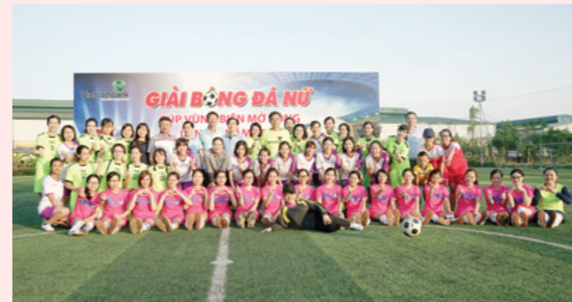
Các đội chụp ảnh lưu niệm