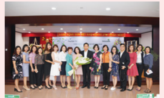
Đại diện Ban Lãnh đạo Vietcombank và các chị em CBNV TSC cùng diễn giả chụp ảnh lưu niệm tại chương trình giao lưu