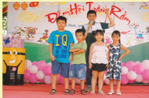
Các em thiếu nhi được tham gia các trò chơi trên sân khấu

Ngày 29/09/2017, Chi đoàn cơ sở Vietcombank Bình Phước đã tổ chức thành công chương trình “Đêm hội Trăng Rằm” cho con em CBNV đang công tác tại CN nhân dịp Tết Trung Thu.