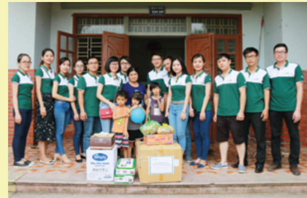
Đoàn thanh niên Vietcombank Hải Phòng tặng quà cho Làng trẻ mồ côi Hoa Phượng