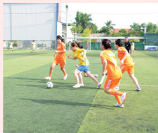
Một pha tranh bóng