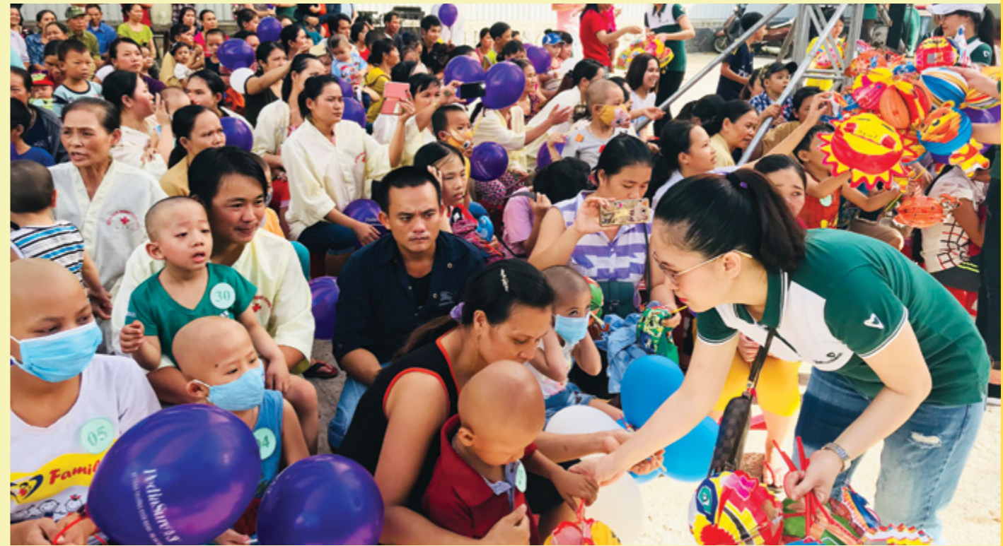
Cán bộ Vietcombank Huế tặng quà Trung thu cho các bệnh nhi tham dự chương trình

Mỗi suất ăn đều được Khoa Dinh dưỡng của Viện lên thực đơn và chế biến với quy trình vệ sinh đảm bảo nghiêm ngặt, hỗ trợ rất tốt cho các bệnh nhân trong việc điều trị bệnh và phục hồi sức khỏe. Suất cơm tuy có giá trị nhỏ về mặt vật chất, nhưng có giá trị rất lớn về mặt tinh thần đối với bệnh nhân đang điều trị tại Viện, để các gia đình bớt đi được gánh nặng về kinh tế, bớt nỗi lo trang trải các chi phí trong thời gian điều trị bệnh kéo dài.