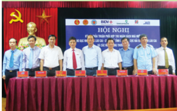
Lãnh đạo các đơn vị tham gia ký thỏa thuận hợp tác thu NSNN trên địa bàn Lào Cai

NGÀY 22/9/2017, TẠI TRỤ SỞ KHO BẠC NHÀ NƯỚC (KBNN) TỈNH, VIETCOMBANK LÀO CAI CÙNG CÁC NHTM KHÁC TRÊN ĐỊA BÀN ĐÃ KÝ KẾT THỎA THUẬN PHỐI HỢP THU NGÂN SÁCH NHÀ NƯỚC (NSNN) VỚI KBNN, CỤC THUẾ, CỤC HẢI QUAN TỈNH LÀO CAI.