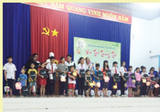
Tặng quà Trung Thu cho thiếu nhi