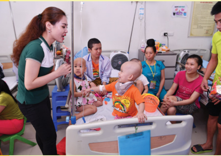
Đoàn viên TN Vietcombank TSC trao tặng quà Trung Thu cho các bệnh nhân nhi