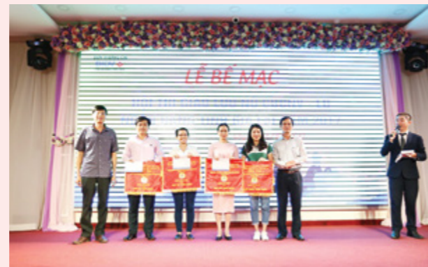
Nữ công CĐCS Vietcombank Gia Lai giành giải Nhất