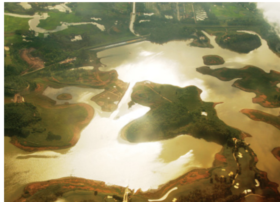
Hồ Đống Mò nhìn từ trên cao

Cơ thể như đang ngồi xích đu giữa bầu trời. Bay giữa không trung, ở trên cao nhìn xuống thấy Hà Nội phủ một màu xanh của cây cối và sông hồ