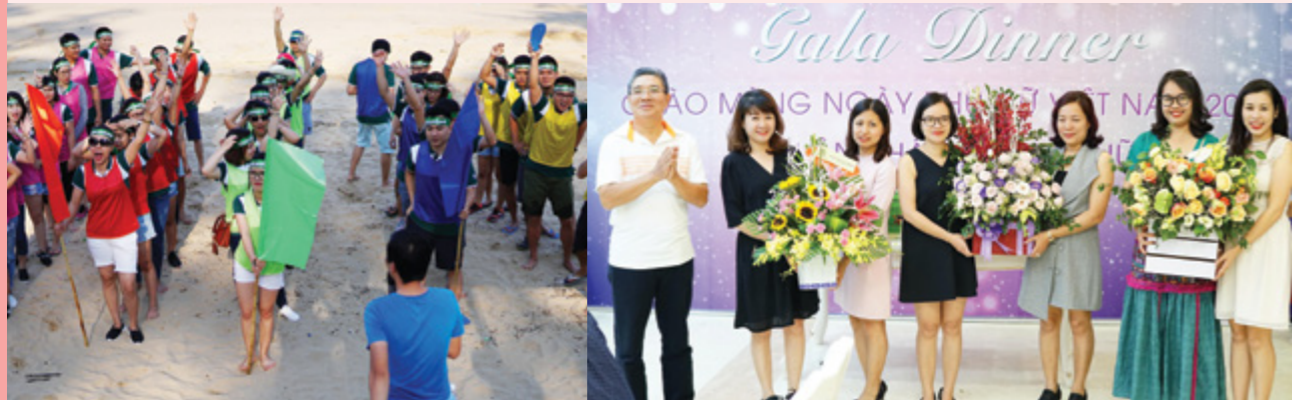
Các đội chơi đã sẵn sàng