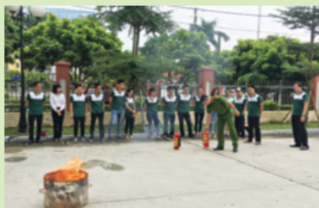
Giảng viên đang hướng dẫn học viên cách sử dụng bình chữa cháy

Các học viên cũng được diễn tập một vụ trộm cướp tại ngân hàng, cách quan sát, nhận biết và xử lý tình huống khi có trộm đột nhập. Tiếp đến, từng học viên được thực hành sử dụng các phương tiện chữa cháy như bình bột, bình CO2 hay nước để dập tắt đám cháy một cách nhanh chóng. Kết thúc lớp tập huấn, các học viên được cấp giấy chứng nhận huấn luyện nghiệp vụ PCCC.