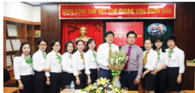
Bí thư Đảng ủy – Giám đốc Vietcombank Chi nhánh Sở giao dịch và Chi bộ 5