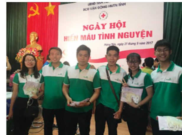
Cán bộ nhân viên VCB tham gia hiến máu tình nguyện.

“Ngày hội hiến máu tình nguyện tỉnh Hưng Yên 2017” mang trong đó thông điệp của lòng nhân ái, sự sẻ chia, làm xúc động hàng triệu trái tim của cộng đồng và đem lại ấn tượng sâu sắc cho những người “bạn đồng hành” với lễ hội. Những đóng góp, chia sẻ của CBNV Vietcombank Hưng Yên sẽ góp phần nâng cao giá trị của những hoạt động nhân đạo, những nghĩa cử nhân ái tới cộng đồng.