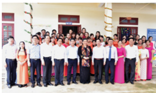
Ủy viên Bộ Chính trị, Phó Chủ tịch thường trực Quốc hội Tông Thị Phóng cùng các đại biểu và thầy cô giáo trường mầm non xã Trấn Yên chụp ảnh lưu niệm

Ủy viên Bộ Chính trị, Phó Chủ tịch thường trực Quốc hội Tông Thị Phóng cùng các đại biểu và thầy trò Trường Phổ thông Dân tộc nội trú THCS huyện Bắc Sơn chụp ảnh lưu niệm