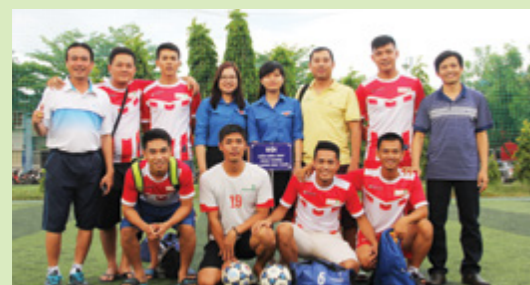
Đội bóng đá mini Vietcombank Ninh Thuận

Nhân Ngày Doanh nhân Việt Nam (13/10), từ ngày 16/09 - 13/10/2017, Vietcombank Ninh Thuận đã tham gia giải bóng đá Mini do Đảng ủy khối Doanh nghiệp, Liên đoàn lao động và Hiệp hội Doanh nghiệp tỉnh Ninh Thuận tổ chức.