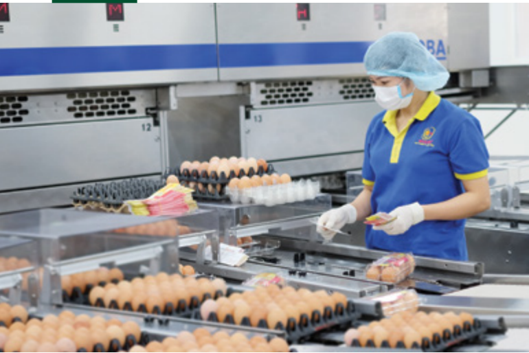
Dây chuyền xử lý và chế biến trứng gia cầm công nghệ cao tại nhà máy của Công ty TNHH Ba Huân Hà Nội - dự án do Vietcombank cấp tín dụng hơn 60 tỷ đồng