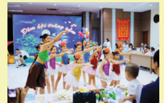
Các cháu múa tập thể, tham gia hát “Bố là tất cả”