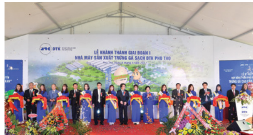
Lễ khánh thành giai đoạn 1 Nhà máy sản xuất trứng gà sạch ĐTK Phú Thọ - dự án do Vietcombank cho vay trên 600 tỷ đồng

Trên 2.500 tỷ đồng đã được Vietcombank giải ngân cho vay lĩnh vực nông nghiệp ứng dụng công nghệ cao, nông nghiệp sạch.