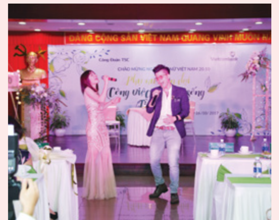
Những tiết mục văn nghệ đặc sắc