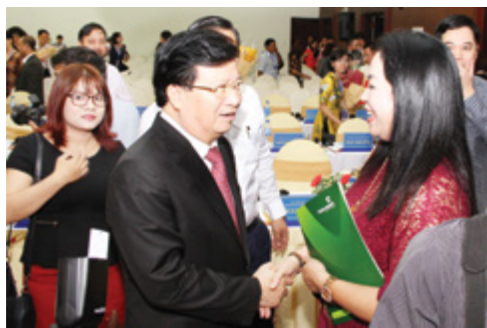
Giám đốc Vietcombank Quảng Ngãi chào Phó Thủ tướng Trịnh Đình Dũng

NGÀY 20/10/2017, TẠI TP. QUẢNG NGÃI, UBND TỈNH QUẢNG NGÃI ĐÃ TỔ CHỨC HỘI NGHỊ XÚC TIẾN ĐẦU TƯ “QUẢNG NGÃI - HỢP TÁC ĐẦU TƯ VÀ PHÁT TRIỂN” NĂM 2017. Đ/C TRỊNH ĐÌNH DŨNG - ỦY VIÊN TW ĐẢNG, PHÓ THỦ TƯỚNG CHÍNH PHỦ ĐÃ THAM DỰ VÀ CHỈ ĐẠO HỘI NGHỊ.