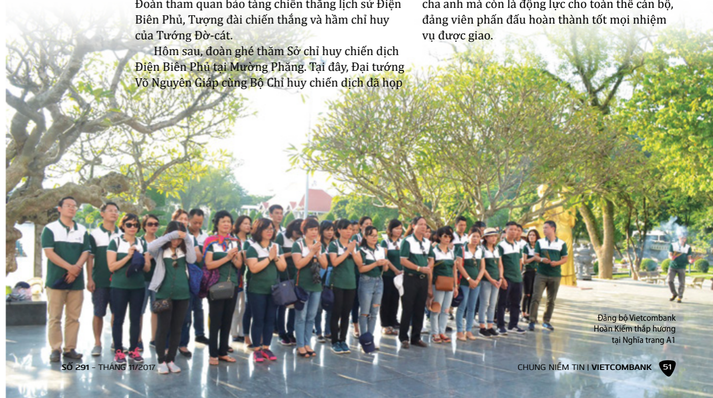
Đảng bộ Vietcombank Hoàn Kiếm thấp hương tại Nghĩa trang A1

Chuyến đi về nguồn đã đem lại cho toàn thể đảng viên Đảng bộ Vietcombank Hoàn Kiếm những bài học vô cùng sâu sắc. Đó là: Có bền bỉ mới thành công; Biết đối thủ, biết ta để ra quyết sách phù hợp cho từng thời điểm; Phải luôn nghĩ về các giải pháp thay vì khó khăn trước mắt và cuối cùng là Tinh thần đoàn kết, tương hỗ sẽ tạo ra sức mạnh vô địch. Những chuyến đi về nguồn không chỉ bày tỏ tấm lòng tri ân của Đảng bộ Vietcombank Hoàn Kiếm đối với thế hệ cha anh mà còn là động lực cho toàn thể cán bộ, đảng viên phấn đấu hoàn thành tốt mọi nhiệm vụ được giao.