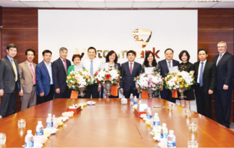
Chủ tịch HĐQT và Tổng Giám đốc tặng hoa chúc mừng các nữ lãnh đạo Vietcombank