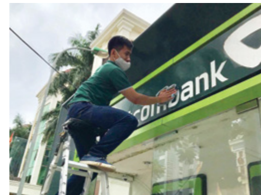
Làm sạch biển máy ATM

Sự tham gia tích cực của đông đảo đoàn viên thanh niên Vietcombank Thái Nguyên trong chương trình đã thể hiện tinh thần nỗ lực, ý thức của CBNV trong việc xây dựng và quảng bá hình ảnh thương hiệu Vietcombank chuyên nghiệp, thân thiện tới khách hàng.