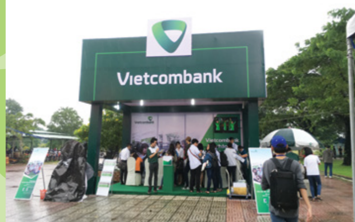
Hoạt động tư vấn, cung cấp dịch vụ VCB cho tân sinh viên diễn ra sôi động với nhiều khuyến mãi, quà tặng hấp dẫn tại khuôn viên nhà trường