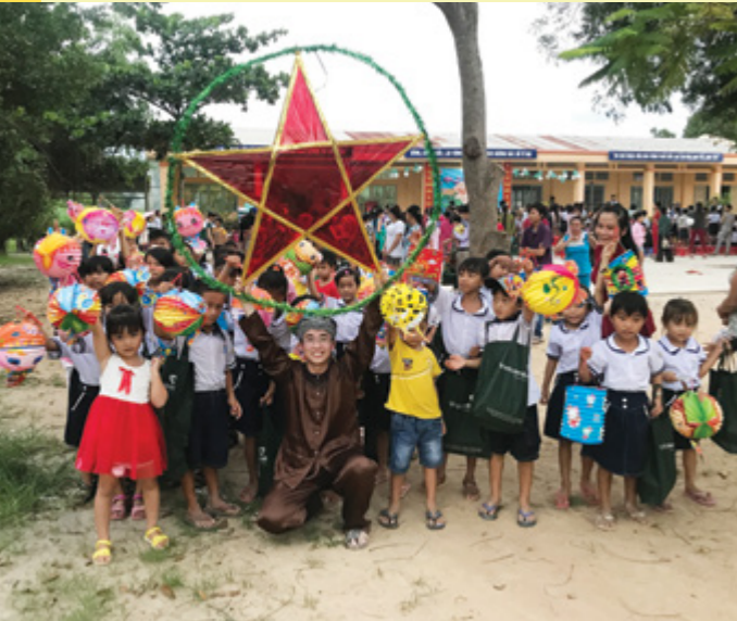
Một gian trò chơi dành cho các em thiếu nhi

N gày 30/09/2017, Đoàn cơ sở Vietcombank TP.HCM đã thực hiện thành công chương trình “Trung Thu yêu thương” tại ấp Tà Dơ, xã Tân Thành, huyện Tân Châu, tỉnh Tây Ninh.