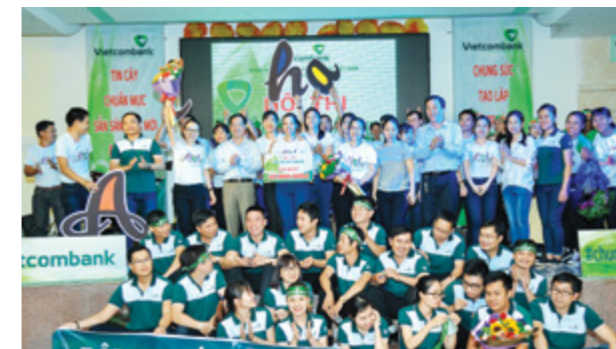
Ban Tổ chức, Ban Giám khảo chụp ảnh lưu niệm cùng các đội dự thi