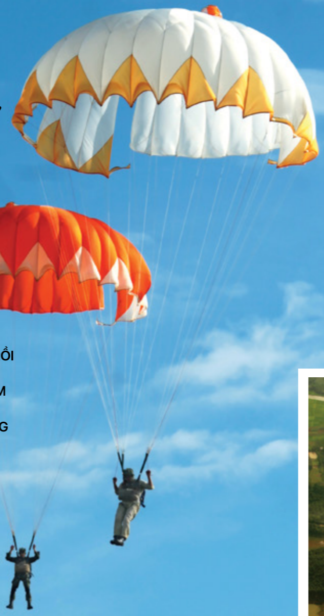
Bay giữa bầu trời Hà Nội

Sau những tháng ngày tập luyện mệt mỏi thì ngày nhảy dù cũng đã đến. Cửa ải cuối cùng là đo huyết áp phải ổn định mới được phép đeo dù và lên máy bay. Đeo dù chính lên lưng, dù dự bị phía trước bụng, đội mũ bảo hiểm, kiểm tra các móc dây và bước lên máy bay. Cánh quạt của chiếc máy bay AH2 của Liên Xô (cũ) mà ngày thường chỉ nhìn thấy trên TV trong các bộ phim của Liên Xô từ hồi Chiến tranh Thế giới thứ Hai quay tít.