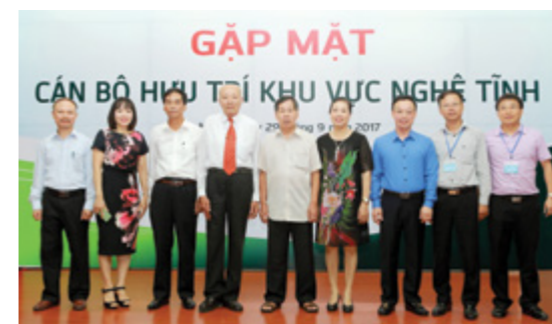
Đại diện Ban Giám đốc CN Nghệ An, CN Hà Tĩnh, CN Bắc Hà Tĩnh và CN Vinh chụp ảnh lưu niệm cùng Ban liên lạc hội hưu trí khu vực Nghệ An và Hà Tĩnh

Nhân Ngày Quốc tế Người cao tuổi, ngày 01/10/2017, tại TP. Vinh, Vietcombank Nghệ An vui mừng và vinh dự được đón tiếp 18 cán bộ hưu trí hiện đang sinh sống tại Nghệ An và Hà Tĩnh.