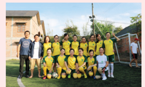
Giải bóng đá nữ chào mừng ngày Phụ nữ Việt Nam khởi thi đua 15 của Vietcombank CN Phú Quốc