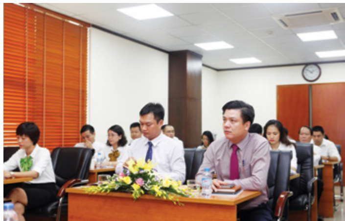
Đại hội của Chi bộ thuộc Đảng bộ Vietcombank chi nhánh Sở giao dịch