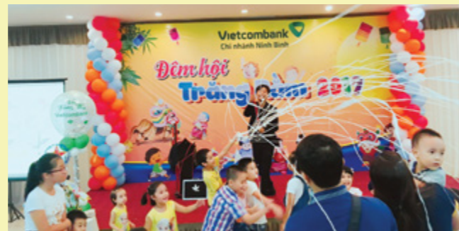
Các tiết mục, trò chơi trong Đêm hội