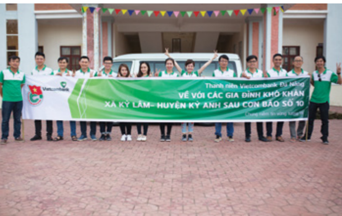
Các thành viên trong chuyến đi