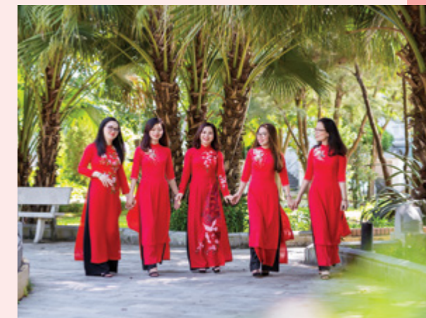
Cán bộ nữ Vietcombank Thái Nguyên dịu dàng trong nắng Thu vàng