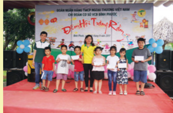
Tết Trung Thu tại Vietcombank CN Phú Quốc

Tối 03/10/2017, BCH CĐCS Vietcombank Phú Quốc đã tổ chức vui Tết Trung Thu cho hơn 20 cháu thiếu nhi là con của CBNV tại CN.