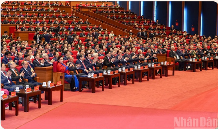
Các đồng chí lãnh đạo, nguyên lãnh đạo Đảng, Nhà nước và các đại biểu tại phiên khai mạc Đại hội đại biểu toàn quốc lần thứ XIV của Đảng ngày 20/01/2026 tại Trung tâm Hội nghị Quốc gia, Hà Nội