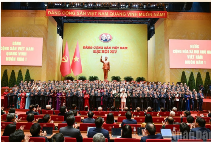
Ban Chấp hành Trung ương khóa XIV ra mắt Đại hội