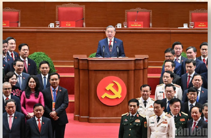
Tổng Bí thư Tô Lâm thay mặt Ban Chấp hành Trung ương Đảng khóa XIV phát biểu ý kiến tại Đại hội đại biểu toàn quốc lần thứ XIV của Đảng