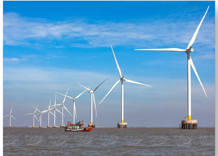
Đầm Dơi, Cà Mau

Việc giám sát và phản biện phải đi vào thực chất, tập trung vào những vấn đề Nhân dân quan tâm trực tiếp, những điểm nghẽn trong thực thi chính sách và những tác động xã hội cụ thể của nghị quyết.