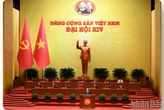
Đoàn Chủ tịch điều hành Phiên khai mạc Đại hội đại biểu toàn quốc lần thứ XIV của Đảng