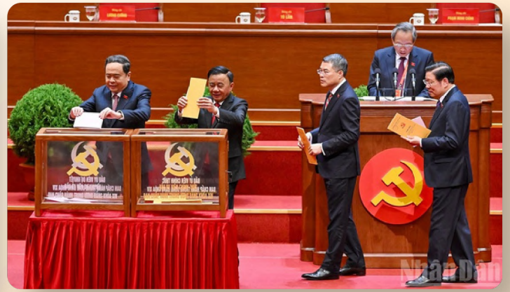
Các đồng chí lãnh đạo tham gia bỏ phiếu tại Đại hội đại biểu toàn quốc lần thứ XIV của Đảng