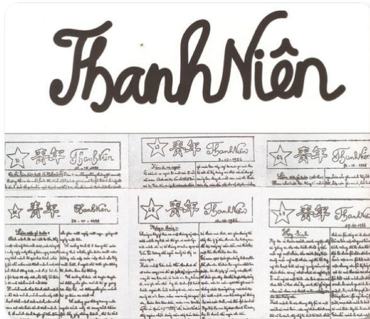
Báo Thanh niên, cơ quan ngôn luận của Hội Việt Nam Cách mạng Thanh niên do Nguyễn Ái Quốc sáng lập tại Quảng Châu (Trung Quốc)