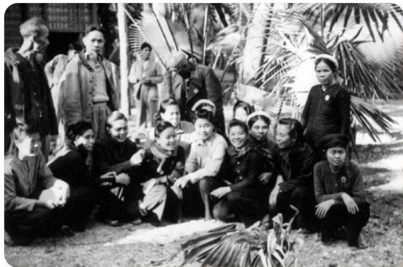
Chủ tịch Hồ Chí Minh và đồng chí Hồ Tùng Mậu gặp gỡ các đại biểu tham dự Đại hội Đảng toàn quốc lần thứ II (3/1951)