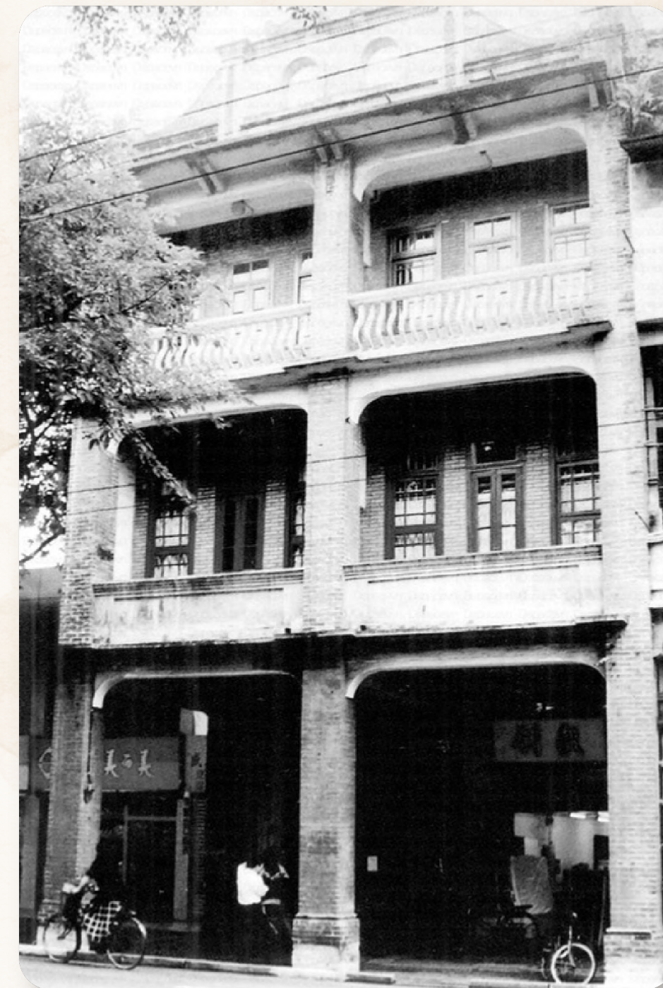
Ngôi nhà số 13, nay là số 248 - 250, đường Văn Minh (Quảng Châu, Trung Quốc) - trụ sở của Hội Việt Nam cách mạng Thanh niên.

Trong cuộc kháng chiến trường kỳ chống thực dân Pháp xâm lược, đồng chí Hồ Tùng Mậu đã hoàn thành xuất sắc nhiệm vụ và anh dũng hy sinh, để lại tấm gương đạo đức cách mạng và một lẽ sống cao đẹp: Vì nước, vì dân, hy sinh vì nghĩa lớn.