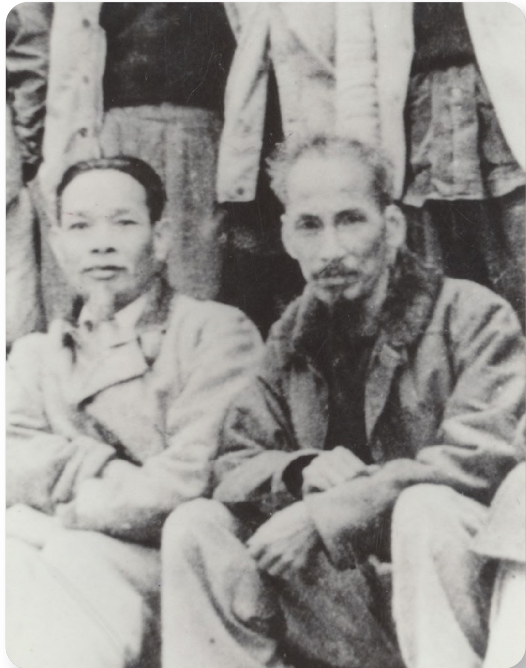
Đồng chí Hồ Tùng Mậu chụp ảnh cùng Bác Hồ