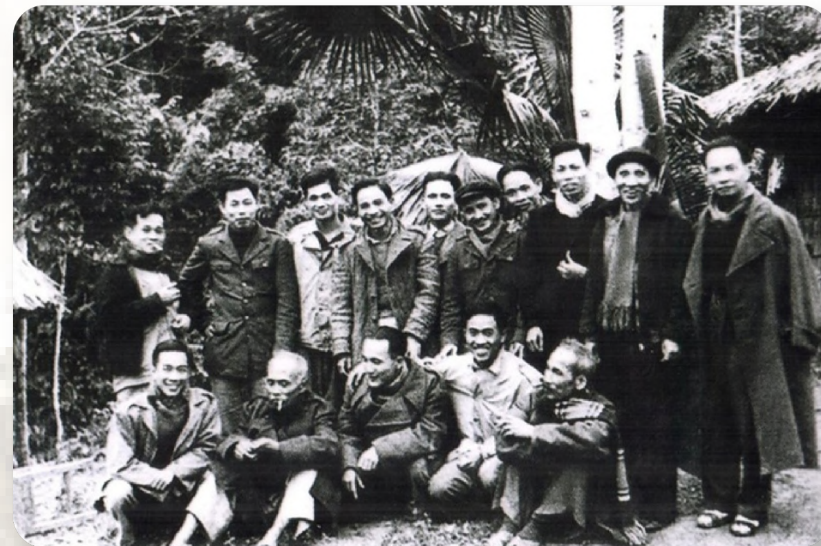
Bác Hồ (ngồi đầu tiên, từ phải sang) chụp ảnh cùng một số Ủy viên Trung ương Đảng khóa II (năm 1951) tại Chiêm Hóa, Tuyên Quang. Đồng chí Hồ Tùng Mậu đứng thứ tư, từ phải sang

Ở đồng chí Hồ Tùng Mậu toát lên đạo lý sống ngàn đời của dân tộc: Yêu nước, thương nòi, nhân ái với con người.